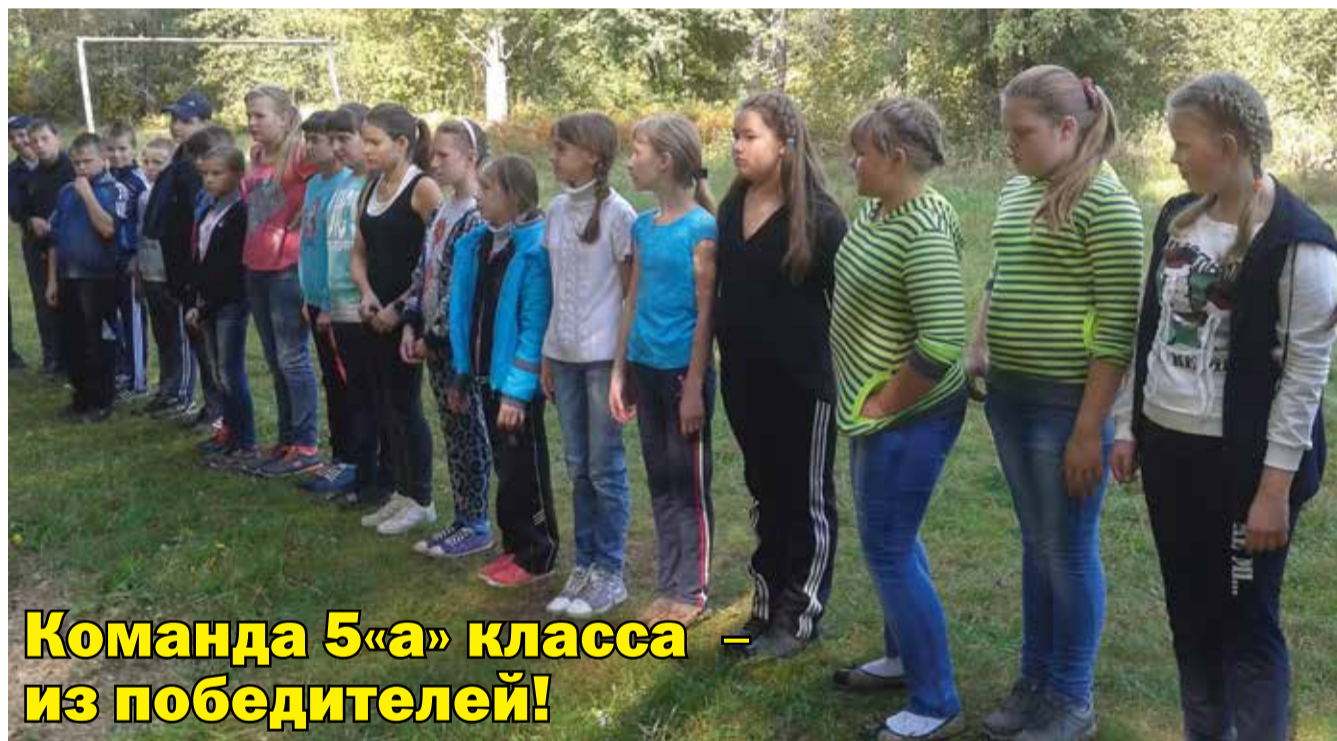
Команда 5«а» класса – из победителей!

На этом наш «День здоровья» завершился. Праздничное настроение, запас энергии и здоровья унесли с собой все участники мероприятия.